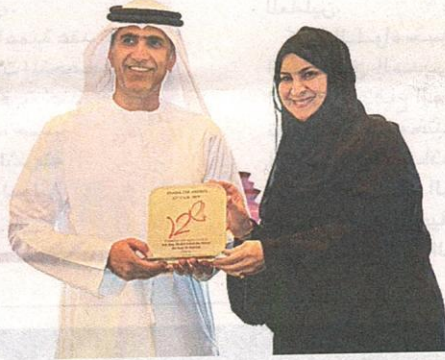
خلال تكريم المؤسسات الفائزة