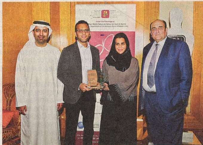
■ Sultan (right) and other officials with the award. The Arabia CSR Awards are regionally and globally renowned as the sustainability benchmark of the Arab region.